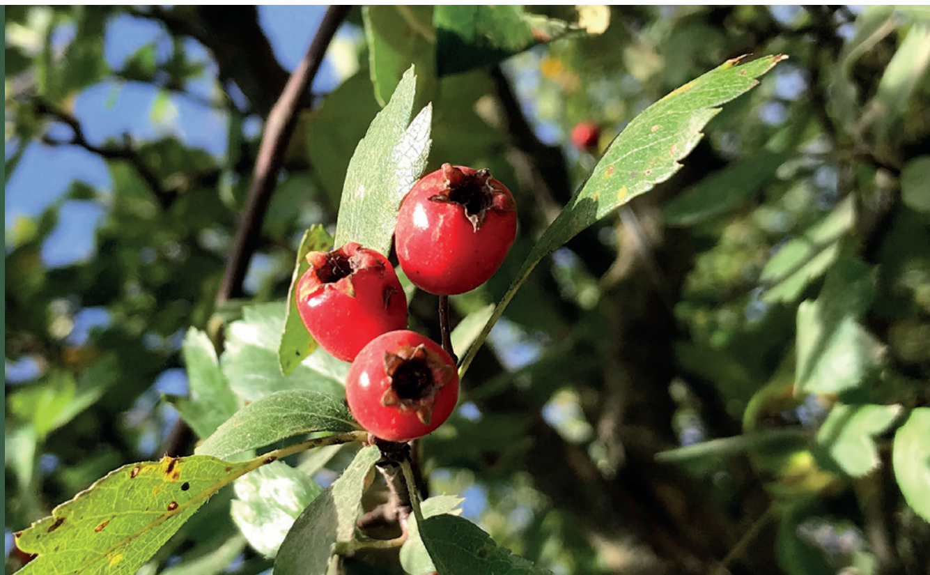
■ fot. E. Budka

* Aktualna, niezbędna dokumentacja określona jest w rozporządzeniu leśno-zadrzewieniowym oraz na stronie www.gov.pl/web/rolnictwo/inwestycje-i-premie-lesno-zadrzewieniowe