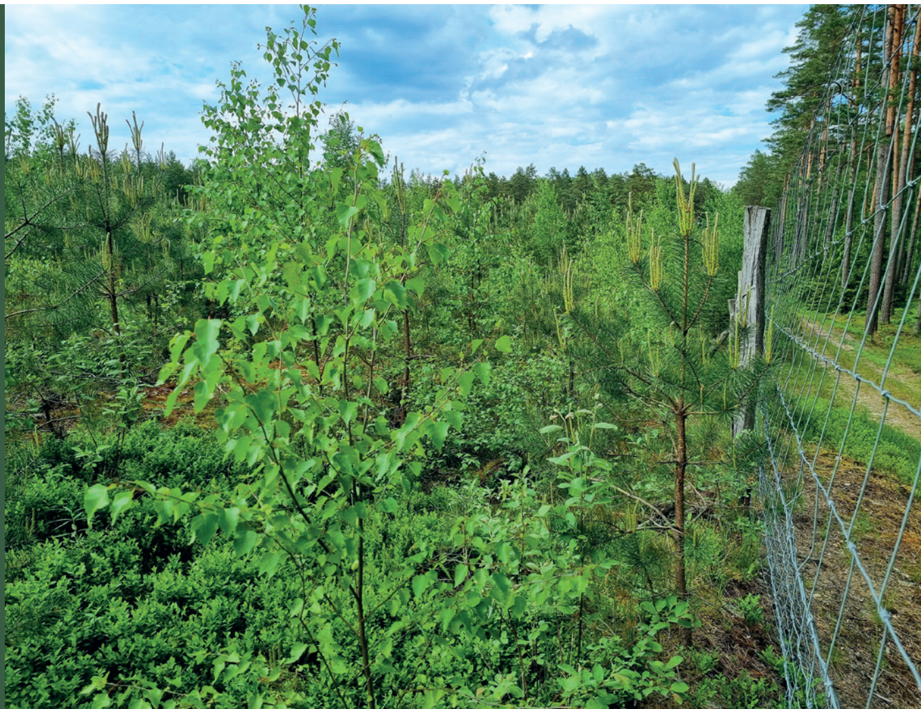
■ fot. M. Baranowska