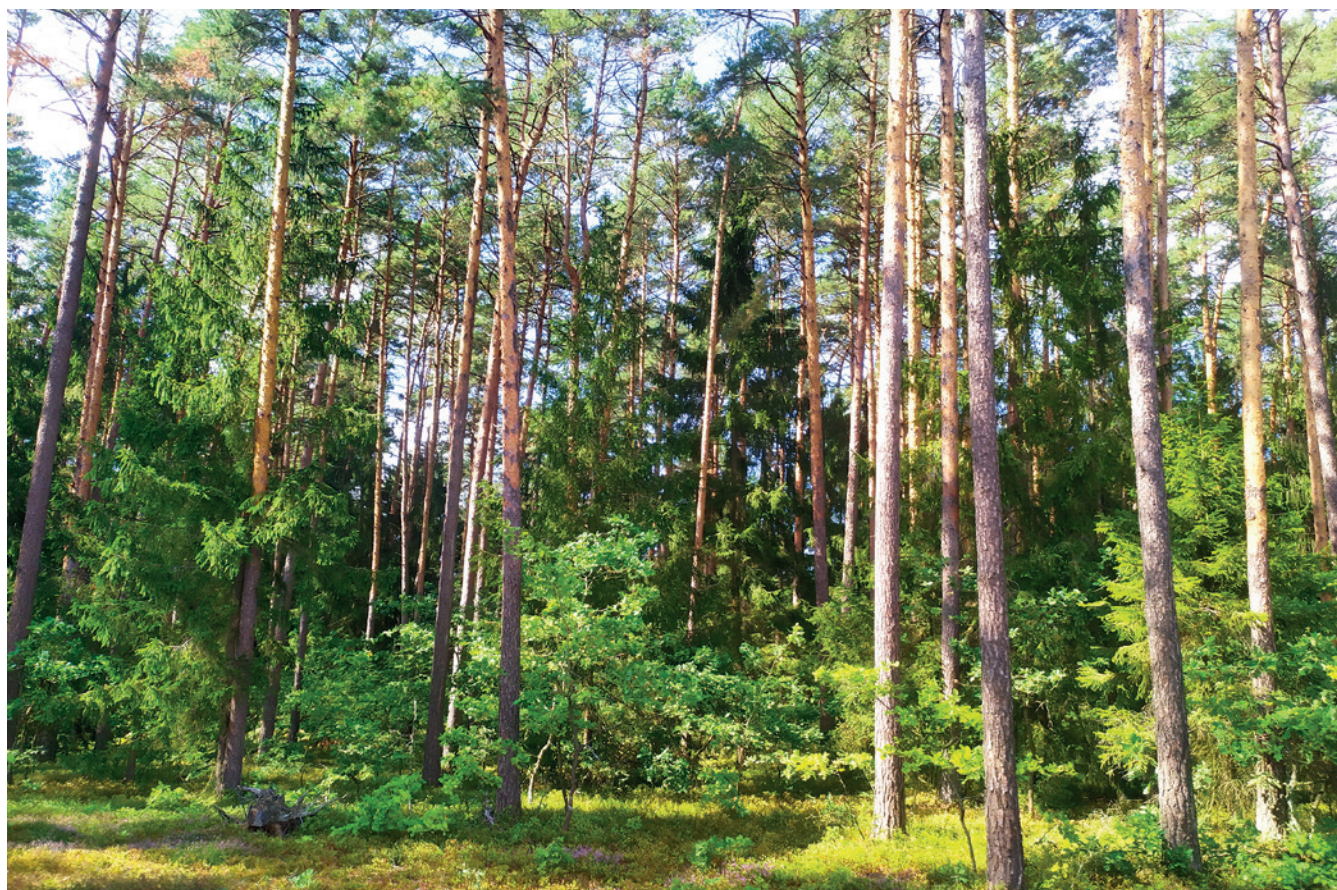
■ fot. M. Kubicki